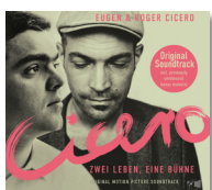
Cicero - Zwei Leben, eine Bühne IOR CD 77148-2