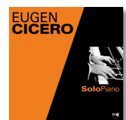
Solo Piano IOR CD 77073-2