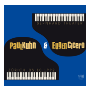
Bernhard Theater Zürich IOR CD 77090-2